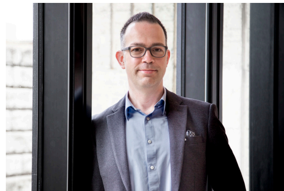
Le président du Conseil d'administration,