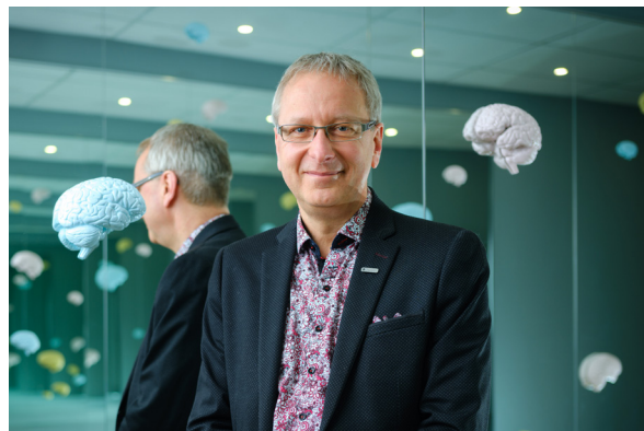
Le directeur général,